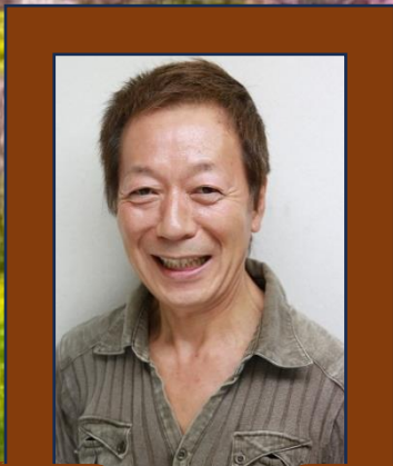
阿久津隆-アナウンサー