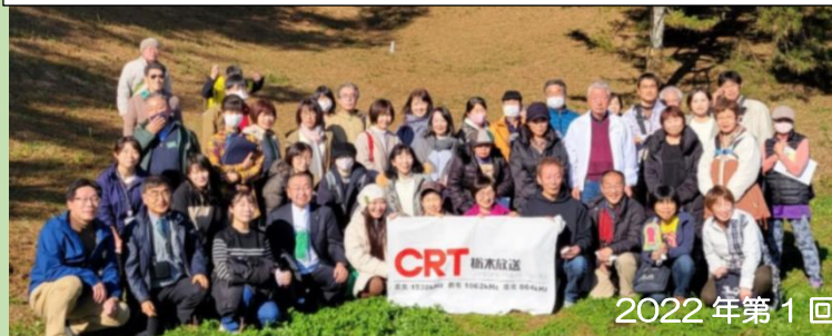
2022年第1回ツアーの様子（イメージ）